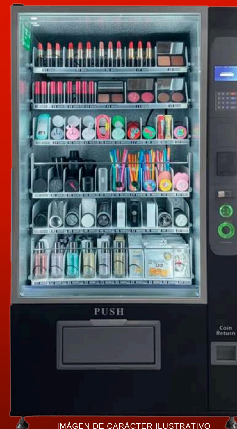
IMÁGEN DE CARÁCTER ILUSTRATIVO